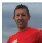
Séance développée par Christophe Cheval Entraîneur du club d'Athlétisme de Perpignan

L'enfant se place de profil dans la zone de lancée, à cheval sur la latte posée au milieu, pied gauche ou droit selon son pied dominant. Au signal, l'enfant devra réaliser 3 lancers consécutifs de manière à atteindre la zone-cible la plus lointaine possible.