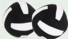
2 BALLE OFFICIELLES