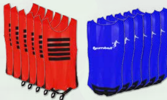
12 CHASUBLES 6 bleues / 6 rouges